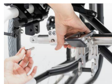
Kit de fijación (montado en la silla)